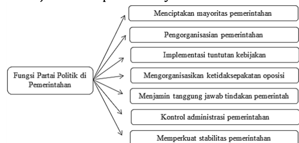
Gambar 2. Indikator fungsi partai politik didalam pemerintahan Kota Pangkalpinang

Adapun mengenai bentuk-bentuk fungsi partai politik yang dilakukan oleh legislator Partai Keadilan Sejahtera dalam menjalankan kiprahnya di parlemen Kota Pangkalpinang periode 2019-2024, peneliti mencoba merangkum dan menguraikan secara rinci kedalam bentuk tabel terkait dengan indikator fungsi partai politik yang dilakukan oleh legislator Partai Keadilan Sejahtera di parlemen yakni: